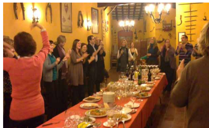
Fiesta final de profesores y show flamenco