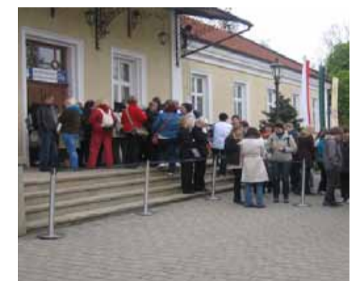
Puerta principal de entrada a las minas de sal