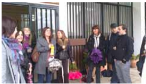
Socios de Reino Unido.

LA LLEGADA de nuestros socios europeos fue un