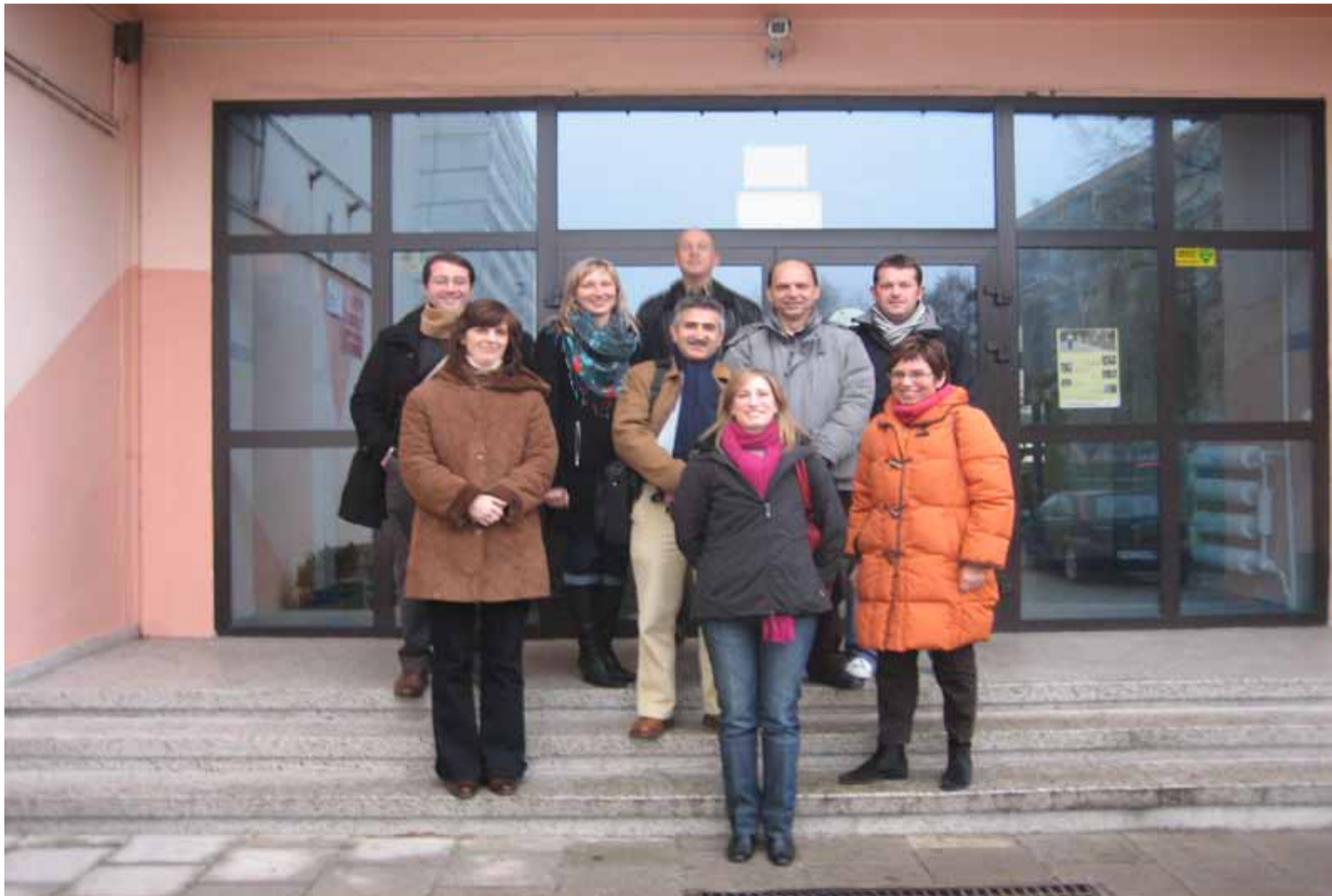
GRUPO INICIAL DE PARTICIPANTES QUE ELABORARON EL PROYECTO