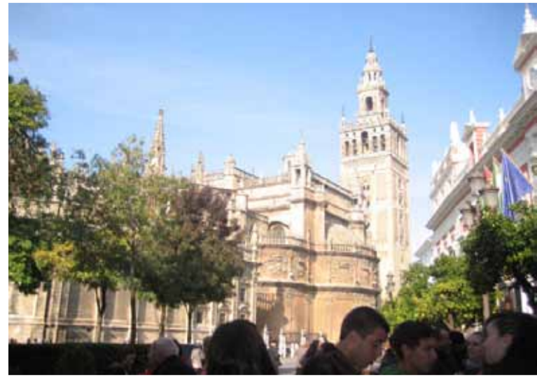
Vista exterior exterior de la catedral

DESPUÉS DE nuestra despedida en la puerta del colegio, el programa para ese día marcaba que a las 19:00 horas nos volviésemos a encontrar para celebrar EL DÍA DE ESPAÑA. Así que a esa hora, grandes y pequeños, padres, profesores y estudiantes nos dimos cita en el teatro del colegio donde se representaron bailes típicos regionales por alumnos del colegio y se cantaron canciones. Cuando estas representaciones terminaron, en la parte final del teatro, las madres habían preparado algunos platos de comidas típicas de los que todos dimos buena cuenta. MAS TARDE, esa misma noche, profesores y padres asistimos a un show flamenco en la Peña flamenca de la Soleá donde se expuso una muestra de cante flamenco y algunos incluso se animaron a bailar sevillanas cuando el ambiente se fue calentando. La fiesta terminó pronto porque al día siguiente, viernes, algunos tenían que madrugar para reemprender de nuevo el viaje de vuelta que les llevaría a sus respectivos países. Y de esta forma concluyó nuestra semana Comenius en España, una experiencia y unos momentos que quedarán grabados siempre en nuestra memoria. ●