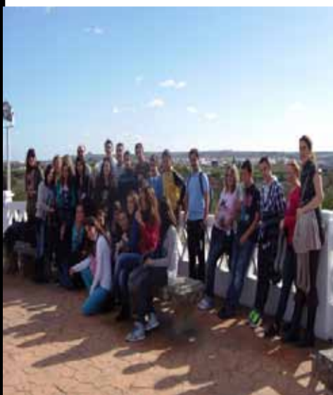
Explanada superior de la Ermita "Virgen de Belén"