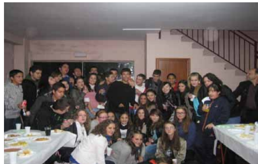
Fiesta final de estudiantes y degustación de platos típicos