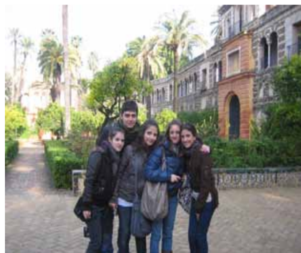
El espacio ajardinado del Alcazar de los Reyes Católicos

MIENTRAS ALGUNOS de los alumnos se comían los bocadillos que sus familias de acogida les habían preparado para ese día, otros aprovechaban el marco de edificaciones y arboleda para hacer fotos individuales y de grupo como la que podemos ver más abajo. Aunque también nos acompañaba en este espacio Antonio, nuestro guía, la encrucijada de calles, caminos y edificios hacía que algunos estudiantes investigaran por su cuenta entre juegos y risas. De esta forma fuimos visitando palacios, jardines y estancias que constituían un auténtico gozo para los sentidos que nos hacía pensar en las historias, intrigas, acuerdos y grandes empresas, como la organización de los viajes que descubrirían América, que se debieron vivir entre aquellos muros. Aunque un conocimiento en profundidad de los espacios hubiera necesitado un día entero, nuestro tiempo para verlo era limitado porque antes de las tres de