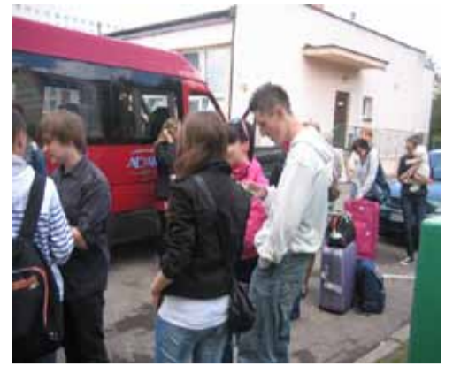
Las familias de acogida reciben a los españoles