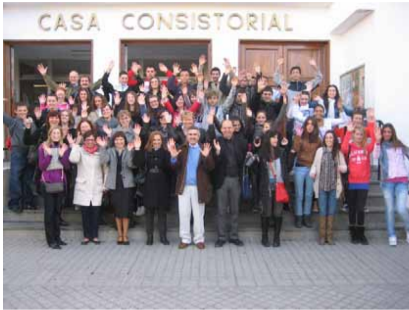
Foto de grupo en las puertas del Ayuntamiento

EN EL salon de actos municipal nos reciben el Alcalde y el consejal de Educación. También se han dado cita para recoger información del evento numerosos medios de comuni-