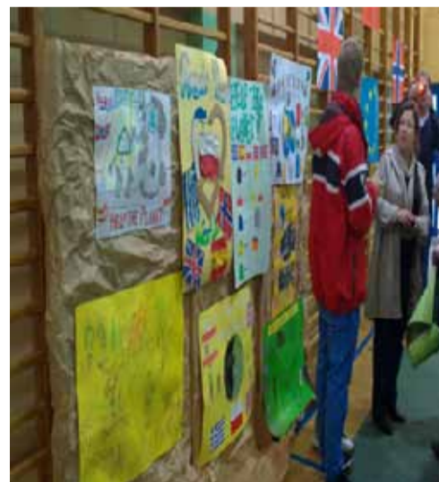
Exposición de los pósters de competición. En uno de los laterales de la sala de usos múltiples, se colgaron los pósters de competición.

EL JUEVES volvíamos a vernos en el centro para seguir compartiendo experiencias docentes durante la mañana, y por la tarde después de un divertido juego de preguntas y respuestas sobre costumbres, cultura, arte, música,... de los diferentes países, entremezclados con piezas musicales de guitarra, violín y piano interpretadas por alumnos y alumnas polacos, se organizó la gran fiesta de despedida donde no faltó ni comida ni bebida. Fue un grato momento donde pudimos degustar platos típicos polacos. Al final de la fiesta, entre llantos y abrazos los niños se despedían de sus compañeros hasta nuestro próximo encuentro que sería en Manchester ●