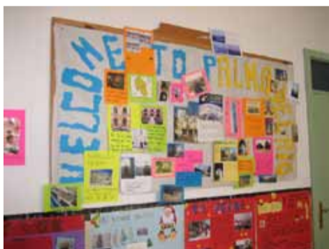
Los tablones de anuncio del colegio se vistieron de colorido y fotos de bienvenida.

EN LA puerta del colegio, que es el lugar donde acordamos recibir a los visitantes europeos, los padres y los alumnos esperaban con impaciencia y nerviosismo la llegada. Cada uno sabía ya, a través de los contactos que habían mantenido sus hijos, quién sería el joven que pararía en casa durante los próximos días, de forma que a medida que la llegada se iba produciendo, se hacían las presentaciones y los invitados con sus nuevas familias de acogida se iban para la nueva casa. Allí, durante unos días experimentarían cómo se vive en España. Compartirían comida, casa, cos-