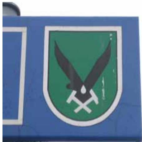
Escudo de la ciudad de Jastrzebie Zdroj

EN ESTA ciudad se desarrollará la segunda movilidad prevista en el proyecto comenius. Los objetivos y tareas que se tendrían que desarrollar en ella ya habían sido fijados en la reunión de nuestro último encuentro en España. Básicamente se trataba de representar un mural con medidas de ahorro energético