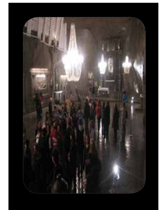
Una impresionante sala de la visita a Wieliczka

FINALIZANDO YA nuestra visita, accedimos a uno de los pisos superiores a través de un estrecho ascensor que los propios mineros utilizaban ya en época más moderna.