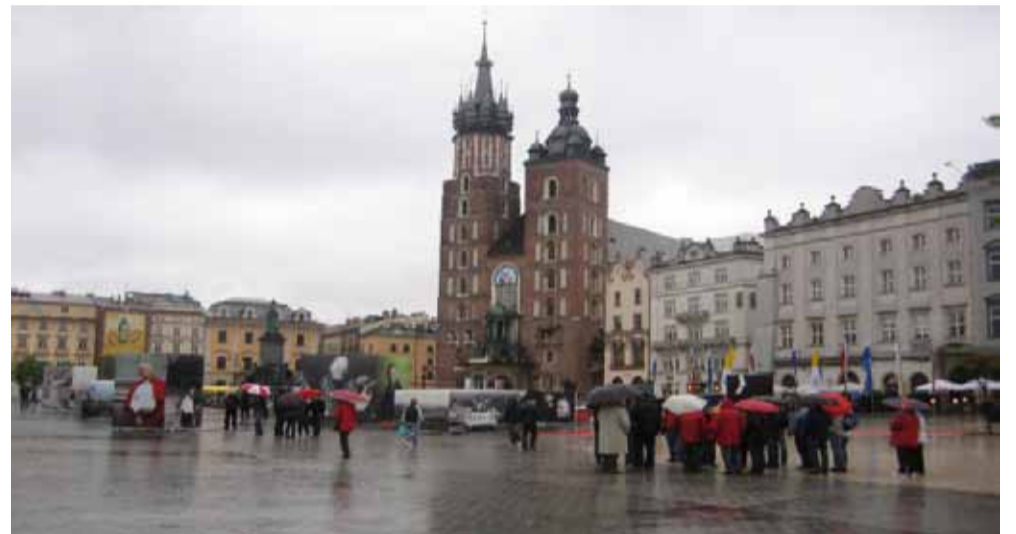
En la plaza central del mercado, el grupo se divide en dos para la visita turística de Cracovia