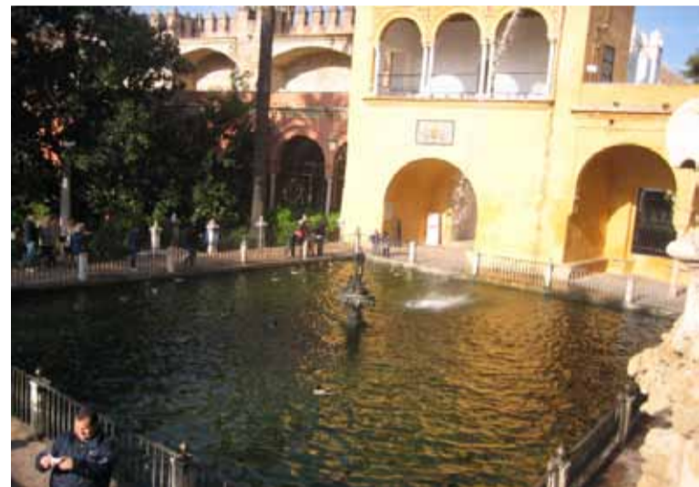
El estanque de Mercurio y el palacio gótico en los Alcázares de Sevilla