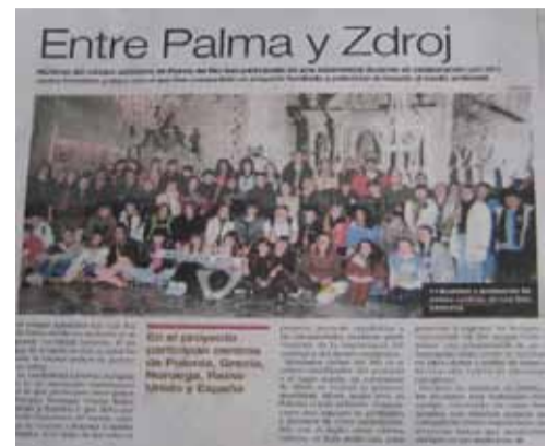
Foto prensa española sobre visita a Polonia